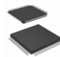
EPM240T100C5N Altera IC CPLD 192MC 4.7NS 100TQFP