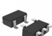
BU7231SG-TR Rohm Semiconductor IC COMPARATOR SGL 5.5V SSOP-5