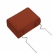
ECW-F2185JAQ Panasonic Electronic Components CAP FILM 1.8UF 5% 250VDC RADIAL