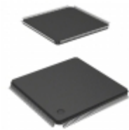
DS72011RB120FPV Renesas Electronics America IC MCU 32BIT ROMLESS 176LFQFP