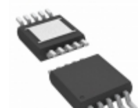
LTC4441IMSE#PBF Linear Technology IC MOSFET DRIVER N-CH 10-MSOP