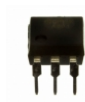
OPIA5010DTUE TT Electronics/Optek Technology OPTOISO 5KV DARL W/BASE 6DIP