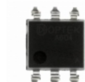
OPIA6010ATUA TT Electronics/Optek Technology OPTOISO 5KV TRANS W/BASE 6SMD