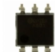
OPIA5010ATUE TT Electronics/Optek Technology OPTOISO 5KV DARL W/BASE 6SMD