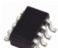
ADG3249BRJ-REEL Analog Devices Inc. IC MUX/DEMUX 2X1 SOT23-8