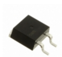
CLA30MT1200NPZ IXYS THYRISTOR PHASE THRU TO263AB