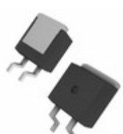
CLA30E1200PC IXYS THYRISTOR PHASE 1200V TO-263