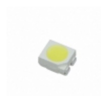
CLA2A-WKW-CYBZ0343 Cree Inc. LED COOL WHITE DIFF 4PLCC SMD