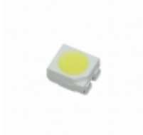
CLA2A-WKW-CYAZ0343 Cree Inc. LED COOL WHITE DIFF 4PLCC SMD