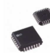
DAC8413FPC Analog Devices Inc. IC DAC 12BIT QUAD READBK 28- PLCC