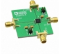
EV1HMC1161LP5 Analog Devices Inc. EVAL BOARD FOR HMC1161