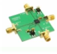
EV1HMC1160LP5 Analog Devices Inc. EVAL BOARD FOR HMC1160