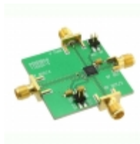
EV1HMC1164LP5 Analog Devices Inc. EVAL BOARD FOR HMC1164