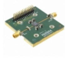
EV1HMC1114LP5D Analog Devices Inc. EVAL BOARD FOR HMC1114LP5DE