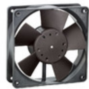
4312GL ebm-papst Inc. FAN AXIAL 119X32MM 12VDC WIRE