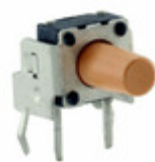
431256083736 Wurth Electronics Inc. SWITCH TACTILE SPST-NO 0.05A 12V