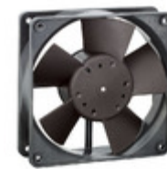
4312G ebm-papst Inc. FAN AXIAL 119X32MM 12VDC WIRE