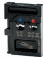
43129 Wiha DIE SET CRIMPS 22-14AWG