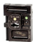
43128 Wiha DIE SET CRIMPS 26-22/12- 10AWG