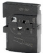
43127 Wiha WIRE CRIMP DIE 24-8AWG