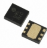
XC6122C219ER-G Torex Semiconductor Ltd IC WATCHDOG TIMER 6-USP