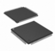
EP2C8T144I8N Altera IC FPGA 85 I/O 144TQFP