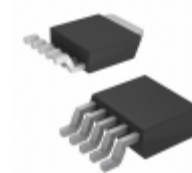
AP1118D25L-13 Diodes Incorporated IC REG LDO 2.5V 1A TO252-5