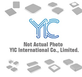
LTC1164AMJ/883 LT LT CDIP