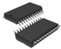
LTC1164CSW#TRPBF Linear Technology IC FILTER BUILDING BLOCK 24-SOIC