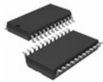
LTC1164ACSW#TRPBF ADI (Analog Devices, Inc.) IC FILTER BUILDING BLOCK 24-SOIC