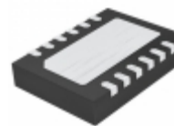
LTC3863IDE#PBF Linear Technology IC REG CTRLR BUCK 12DFN