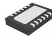
LTC3863IDE#PBF ADI (Analog Devices, Inc.) IC REG CTRLR BUCK 12DFN