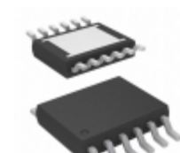
LTC3863HMSE#PBF Linear Technology IC REG CTRLR BUCK 12MSOP