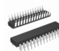
PIC16C57-RCE/P Microchip Technology IC MCU 8BIT 3KB OTP 28DIP