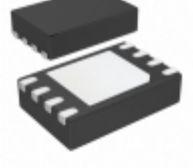
ADG723ACPZ-REEL7 Analog Devices Inc. IC SWITCH SPST 8LFCSP