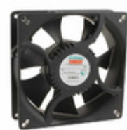
LPC135A23-BTHR Mechatronics FAN AXIAL 135X38MM 230VAC EC