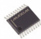
DS2714E+T&R Maxim Integrated IC NIMH CHARGER QUAD 20TSSOP