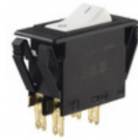
3120-F321-P7T1-W02D-20A E-T-A CIR BRKR THRM 20A 250VAC 50VDC