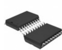
LT1176CSW#PBF ADI (Analog Devices, Inc.) IC REG BCK FLYBCK INV ADJ 20SOIC