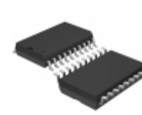
LT1176CSW#PBF Linear Technology IC REG BCK FLYBCK INV ADJ 20SOIC