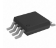
ADG901BRMZ-REEL7 Analog Devices Inc. IC SWITCH SPST 1.65-2.75V 8MSOP