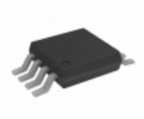
ADG901BRMZ Analog Devices Inc. IC SWITCH SPST 1.65-2.75V 8MSOP