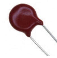
V22ZU1P Littelfuse Inc. VARISTOR 22V 250A DISC 7MM