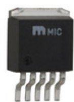
MIC5209BU Microchip Technology IC REG LDO ADJ 0.5A TO263-5