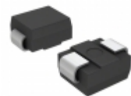
ES2C-M3/5BT Electro-Films (EFI) / Vishay DIODE GEN PURP 150V 2A DO214AA