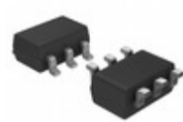
FDC638P AMI Semiconductor / ON Semiconductor MOSFET P-CH 20V 4.5A SSOT-6