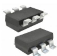
FDC638P Fairchild/ON Semiconductor MOSFET P-CH 20V 4.5A SSOT-6