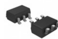
FDC637BNZ AMI Semiconductor / ON Semiconductor MOSFET N-CH 20V 6.2A 6-SSOT