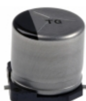
EEV-TG1K470UP Panasonic Electronic Components CAP ALUM 47UF 20% 80V SMD