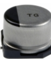
EEV-TG1V330P Panasonic Electronic Components CAP ALUM 33UF 20% 35V SMD