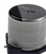
EEV-TG1V221UP Panasonic Electronic Components CAP ALUM 220UF 20% 35V SMD