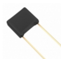
ECW-F2565JA Panasonic Electronic Components CAP FILM 5.6UF 5% 250VDC RADIAL