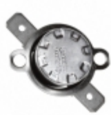
CS710025Y Cantherm THERMOSTAT 100 DEG C NC FASTON