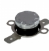
CS709525Y Cantherm THERMOSTAT 95 DEG C NC FASTON