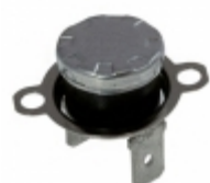
CS709525Z Cantherm THERMOSTAT 95 DEG C N/C FASTON