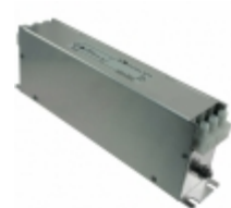
100TDVST2 Delta Electronics LINE FILTER 480VAC 100A CHASS