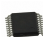
MCP4361-103E/ST Microchip Technology IC DIGITAL POTENTIOMETER 20TSSOP