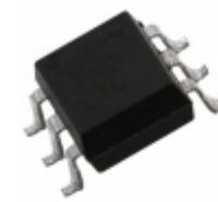
MCT2ES(TA) Everlight Electronics Co Ltd OPTOISO 5KV TRANS W/BASE 6SMD