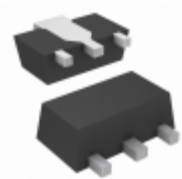
CXT3904 TR Central Semiconductor Corp TRANS NPN 40V 0.2A SOT89