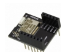
RFD22102 RF Digital Corporation RF TXRX MOD BLUETOOTH CHIP ANT