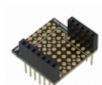
RFD22125 RF Digital RFDUINO PROTO SHIELD