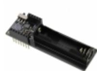
RFD22127 RF Digital RFDUINO SINGLE AAA SHIELD