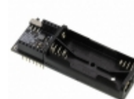
RFD22126 RF Digital RFDUINO DUAL AAA SHIELD