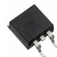
IXFA30N25X3 IXYS Corporation MOSFET N-CHANNEL 250V 30A TO263