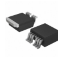
IXFA230N075T2-7 IXYS MOSFET N-CH 75V 230A TO-263-7