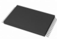
AT28C16-15TI Microchip Technology IC EEPROM 16KBIT 150NS 28TSOP