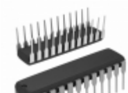
AT28C16-20PI Microchip Technology IC EEPROM 16KBIT 200NS 24DIP