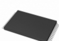
AT28C16-20TC Microchip Technology IC EEPROM 16KBIT 200NS 28TSOP