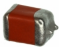
13008-022KESC/HR Electro-Films (EFI) / Vishay CAP TANT 680UF 10V 10% 2917