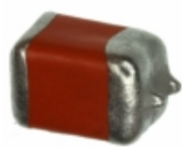
13008-022KESZ/HR Electro-Films (EFI) / Vishay CAP TANT 680UF 10V 10% 2917