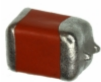
13008-022MESA Electro-Films (EFI) / Vishay CAP TANT 680UF 10V 20% 2917