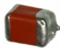
13008-022MESA Vishay Sprague CAP TANT 680UF 10V 20% 2917