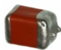
13008-022KESC/HR Vishay Sprague CAP TANT 680UF 10V 10% 2917