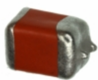
13008-022KESC Vishay Sprague CAP TANT 680UF 10V 10% 2917