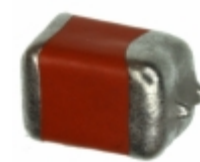
13008-022KESZ Vishay Sprague CAP TANT 680UF 10V 10% 2917