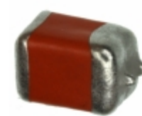
13008-022KESZ/HR Vishay Sprague CAP TANT 680UF 10V 10% 2917