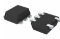
BU4311FVE-TR Rohm Semiconductor IC DETECTOR VOLT 1.1V CMOS 5VSOF