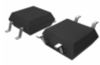
BU4311F-TR Rohm Semiconductor IC DETECTOR VOLT 1.1V CMOS 4SOP