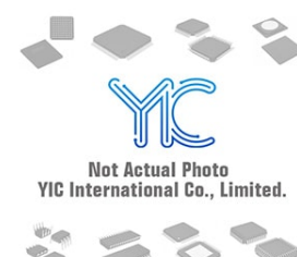
MIC5320-SFYD6 MIC MIC5320-SFYD6 MIC