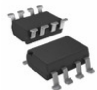
6N135-X007 Electro-Films (EFI) / Vishay OPTOISO 5.3KV TRANS W/BASE 8DIP