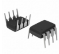
6N135-020E Broadcom Limited OPTOISO 5KV TRANS W/BASE 8DIP