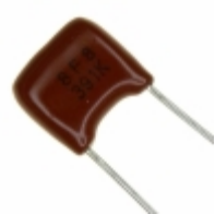
ECQ-B1H391KF Panasonic Electronic Components CAP FILM 390PF 10% 50VDC RADIAL