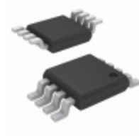
EL5210CYZ-T13 Intersil IC OPAMP VFB 20MHZ RRO 8MSOP