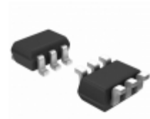
XP0653400L Panasonic Electronic Components TRANS 2NPN 20V 0.015A SMINI6