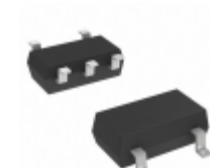
XP0B30100L Panasonic Electronic Components TRANS NPN/PNP DARL 50V SMINI5