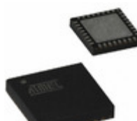
AT97SC3205-H3M4520B Microchip Technology PROD FF IND SPI TPM 4X4 32VQFN S