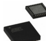
AT97SC3205-H3M45-20 Microchip Technology FF IND SPI TPM 4X4 32VQFN SEK -