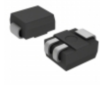
L2X5RP Littelfuse Inc. TRIAC SENS GATE 200V 0.8A DO214