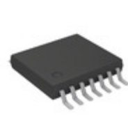
MCP6V94-E/ST Microchip Technology QUAD ZERO DRIFT OP AMP E TEMP