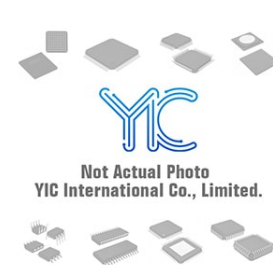
MCP1791-3302E/DC MICROCH MICROCH SOT223