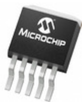
MCP1791-3002E/ET Microchip Technology IC REG LDO 3V 70MA DDPACK