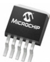
MCP1791T-3302E/ET Microchip Technology IC REG LDO 3.3V 70MA DDPACK