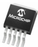
MCP1791-5002E/ET Microchip Technology IC REG LDO 5V 70MA DDPACK