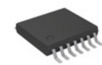
MCP2030AT-I/ST Microchip Technology IC KEYLESS ENTRY AFE 3CH 14TSSOP