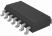
MCP2030-I/SL Microchip Technology IC KEYLESS ENTRY AFE 14SOIC