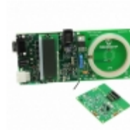
MCP2030DM-TPR Microchip Technology BOARD DEMO PICTAIL MCP2030