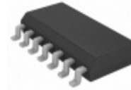
MCP2030A-I/SL Microchip Technology IC KEYLESS ENTRY AFE 3CH 14SOIC