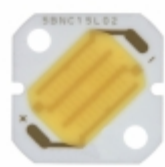
GW5BNC15L02 Sharp Microelectronics LED MOD 3.5WATT ZENIGATA 5000K